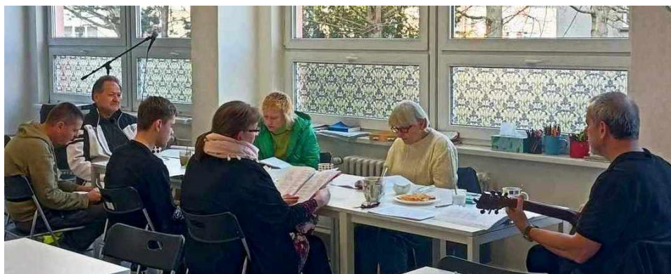
Fotografie z biblické skupinky

V Krumlově i během letních prázdnin bude otevřen šatník pro chudé, kde mají lidé k dispozici nejen oblečení, ale i nádobí, drogerii, boty apod. Co dva týdny máme nedělní shromáždění a každý čtvrtek biblickou skupinku. Nadějně je, že se lidé pomaličku k sobě přibližují, svěřují se se svými osobními myšlenkami a začínají si opatrně důvěřovat. Většina lidí, kteří se u nás scházejí, nechodí do práce (pro stáří nebo nemoc), nevychovávali děti, nežijí „běžné“ životy.