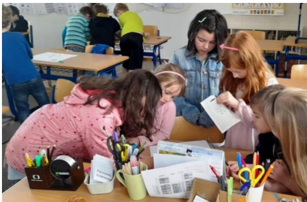
Fotografie ze společného programu střední a starší besídky

V naší besídce se scházíme v menším počtu (většinou tři až osm dětí). Probíráme společně téma milosti . Studujeme Bibli, už tu dospěláčkou. My vedoucí pokládáme hodně otázek a hodně s dětmi debatujeme. Tento rok už si děti nosí svou vlastní Bibli, takže se učí v Božím slově orientovat a také z něj nahlas číst. Také se učíme některé verše nazpaměť (a věřte, že dětem to jde rychleji než vedoucím). Děti mají ještě více otázek než my, a tak se snažíme držet našeho tématu. Někdy jsou ale jejich otázky tak zajímavé, že se tématu raději pustíme. Protože dětská zvědavost je velkou příležitostí pro to, aby Boží slovo mohlo jít do hloubky jejich srdce i mysli.